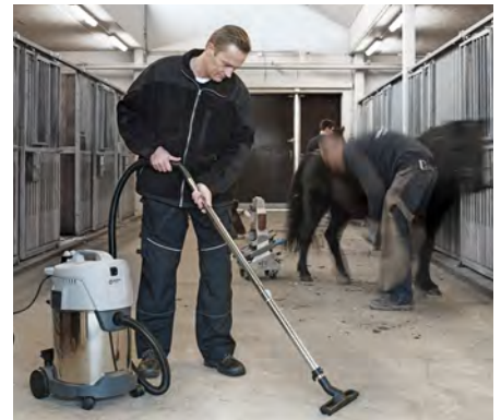
VL200 30 med Inox-behållare för extra krävande miljöer.