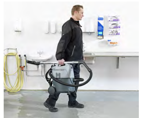
VL200 20 är enkel att transportera tack vare kompakt och ergonomisk design.